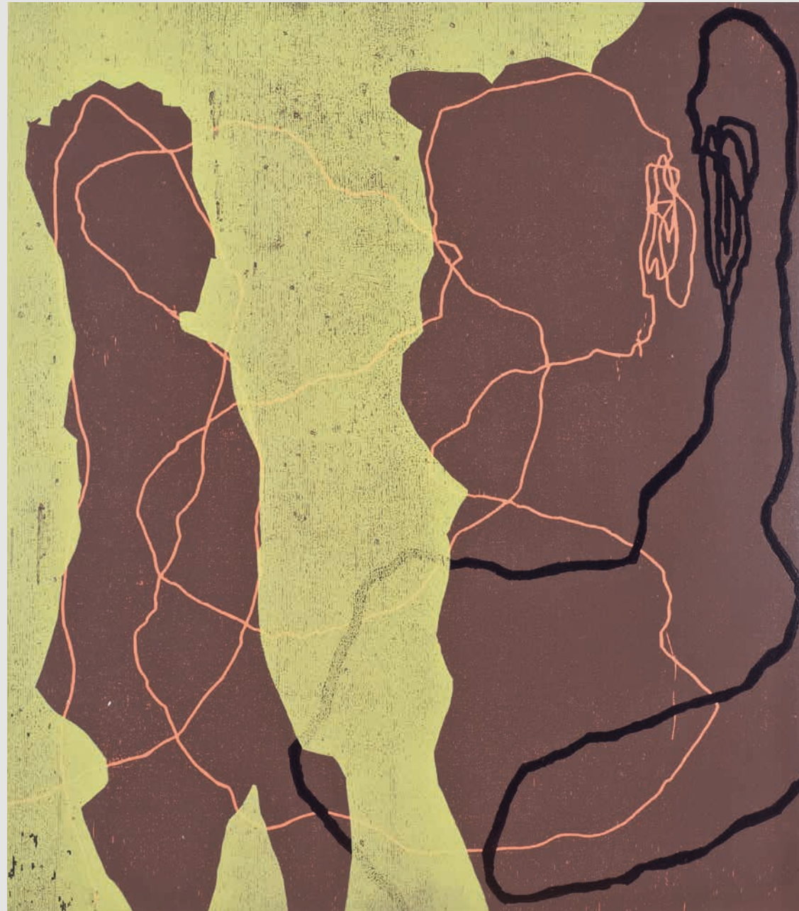
Jo Bukowski, Traum, 2019, Holzschnitt, 80 x 70 cm.