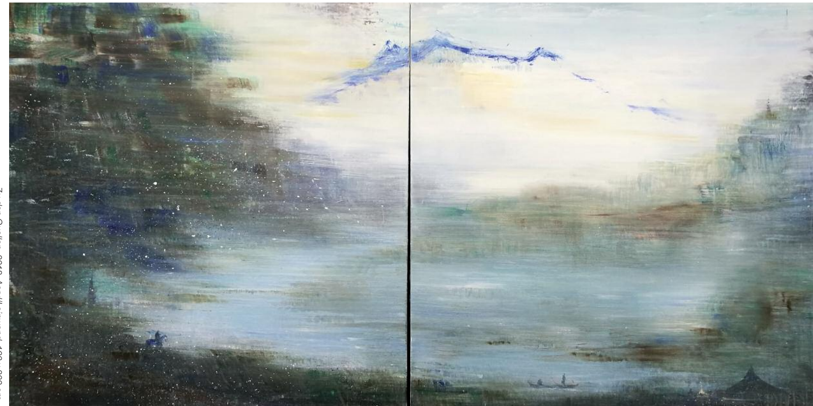
Zu den Quellen, 2018, Acryl/Leinwand, 100 x 200 cm