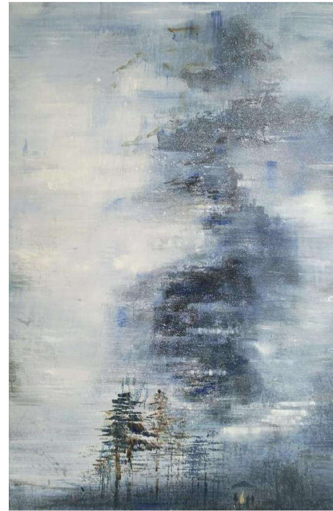
Heimkunft, 2019 Acryl/Leinwand, 210 x 150 cm

In der Wangener Ausstellung zeige ich Bilder, die in dieser Zeit entstanden sind und solche, die ich danach aus der Erinnerung gemalt habe. Durch den räumlichen und zeitlichen Abstand sind sie noch poetischer geworden bzw. versuche ich, den poetischen Charakter zu verstärken. Der Weg geht weiter.