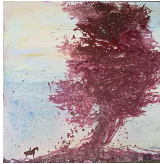
Rückkehr zu den Wurzeln II, 2018 Acryl/Leinwand 119 x 119 cm

Ich bin schon seit 18 Jahren in Stuttgart und erst vor drei Jahren habe ich die Donau entdeckt. Immer wieder bin ich mit Freunden in dieser Gegend gewandert und habe gezeichnet. Der zweimonatige Arbeitsaufenthalt auf Schloß Mochental im Sommer 2018 war für mich eine tiefe Erfahrung mit den Menschen dort und der Landschaft.